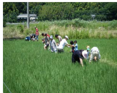
6/20の草刈り体験 もうこんなに立派に育っています！