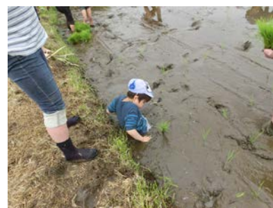
たしかに気持ちいいのだろうけど…