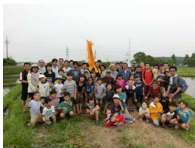
全員集合で、お疲れ様！