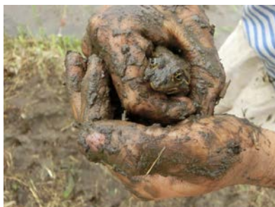
とのさまがえるでした